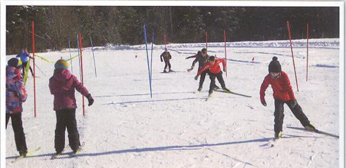
Ein kleines Wettrennen gefällig? Auch das macht Spaß!