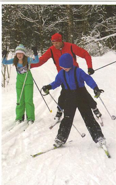
Trotzdem braucht es manchmal die Hilfe des Trainers, um besser weiterzukommen.