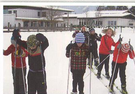
Dann ging's hinaus auf die Loipe – wie weit schaffen wir's wohl?