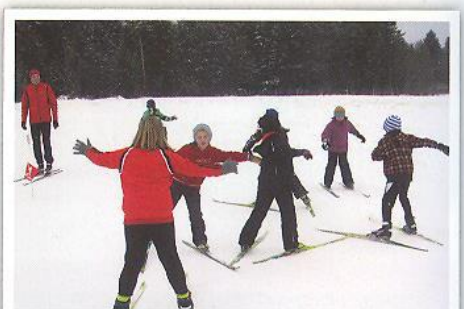
„Schwarzer Mann“ auf Langlaufschiern – den Kindern machte es sichtlich Spaß